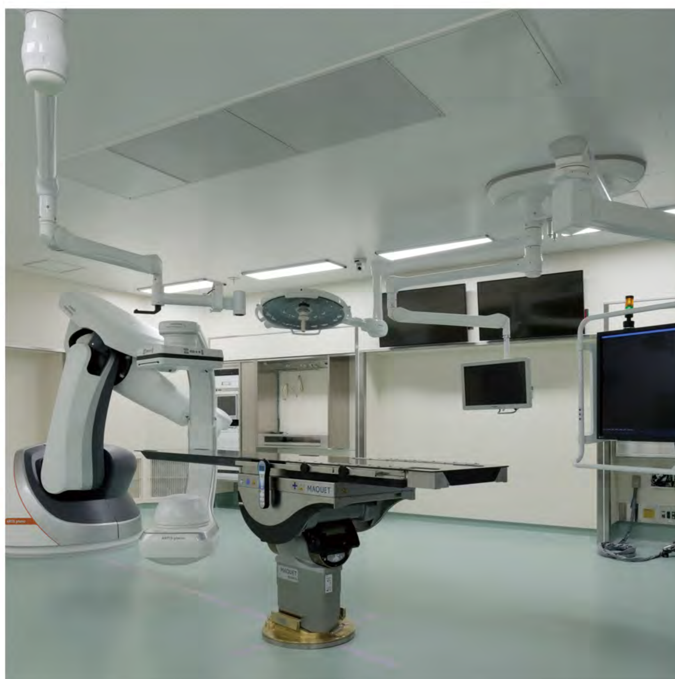
ハイブリッド手術室2