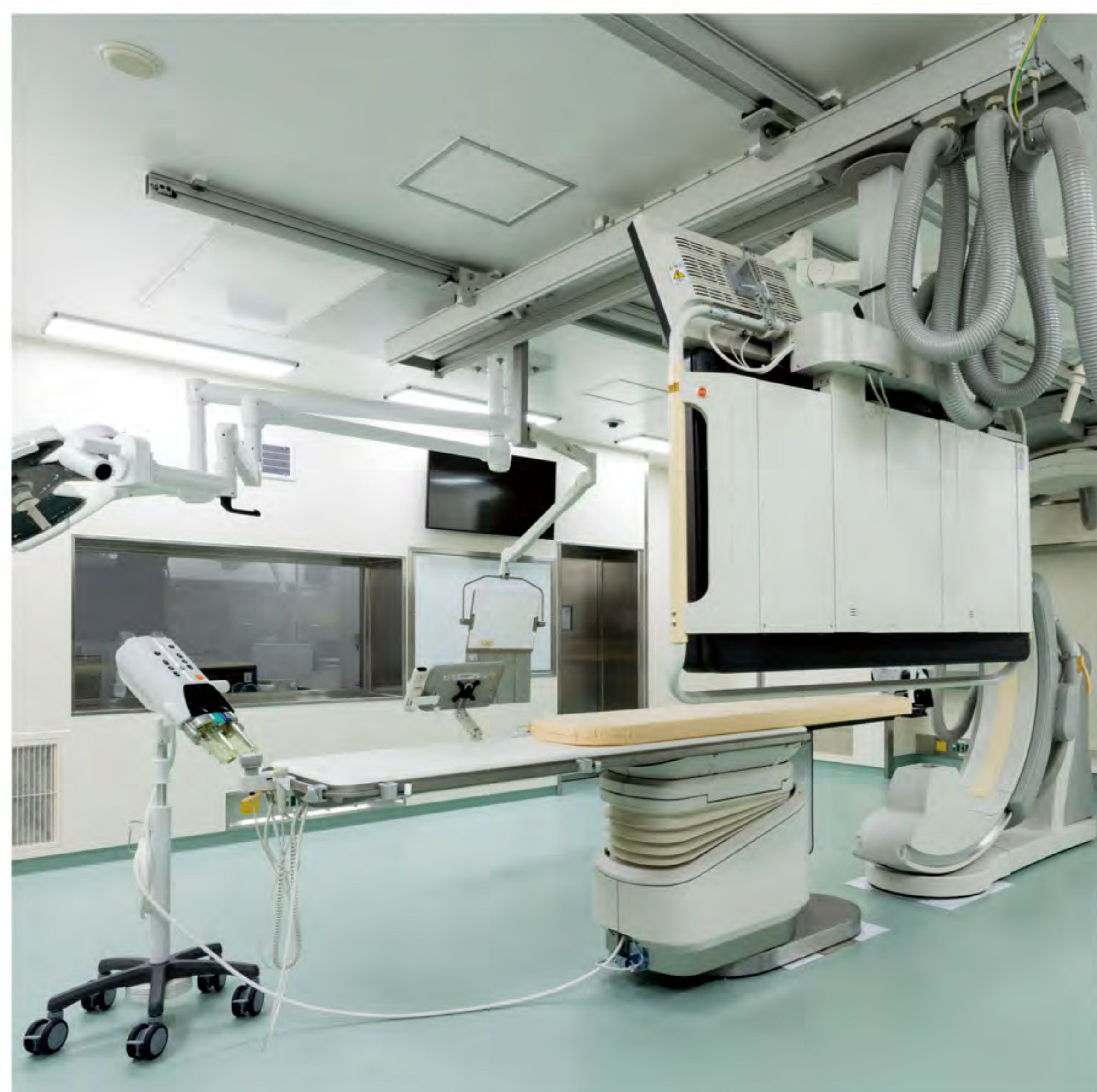
ハイブリッド手術室1